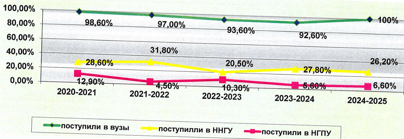
Диаграмма 3 показывает динамику поступления в вузы выпускников 11 классов за последние пять лет.

Из 61 выпускника 11-х классов 2024-2025 учебного года, все 61 человек поступили в различные вузы города и РФ по результатам ЕГЭ (100%), причем из поступивших – 34 человека поступили на бюджетные места (55,7%), все выпускники – очно (100%). В ННГУ им. Н.И. Лобачевского поступили 16 человек (26,2%), 4 человека (6,6%) поступили в НГПУ им. К.Минина. 2 человека поступили в г. Санкт-Петербург, 1 – в г. Москва, 2 – в г. Ярославль.